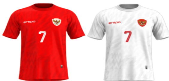
Gambar 1. Jersey Tim Nasional Indonesia diproduksi Erspo

Pada tahun 1954, Presiden Soekarno selaku presiden pertama Indonesia, memerintahkan penggunaan lambang Garuda Pancasila pada pakaian olahraga para atlet yang berlaga internasional.(Kompas.com, 2022) Hal ini kemudian langgeng hingga sekarang, termasuk penggunaan lambang Garuda Pancasila pada jersey Timnas Indonesia. Hal yang dilakukan oleh Muhammad Sadad selaku pemasok jersey untuk Timnas Indonesia dengan menggunakan lambang Garuda Pancasila pada jersey tentunya tidak salah dan melanggengkan kebiasaan yang dimulai oleh Presiden Soekarno. Namun, hal yang menjadi perdebatan adalah mendaftarkan logo Garuda Pancasila pada jersey tersebut sebagai merek atas nama individu.